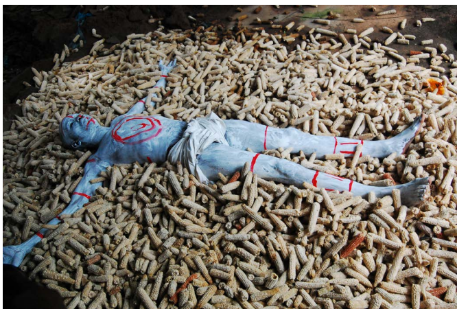
'How We made It'.

Een samenvatting van de onderzoeken, enkele essays en beschouwingen maken deel uit van een speciaal online magazine, The Kleptocracy Project – The Tabloid .