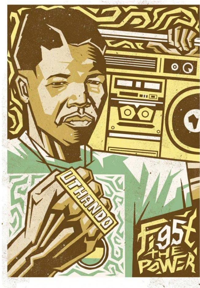
Uthando: liefde © Sindiso Nyoni

Ondanks de beperkingen ten gevolge van de Covid-19 pandemie werd in 2021 met een reeks van programma's en activiteiten gewerkt aan de realisatie van onze doelstellingen.